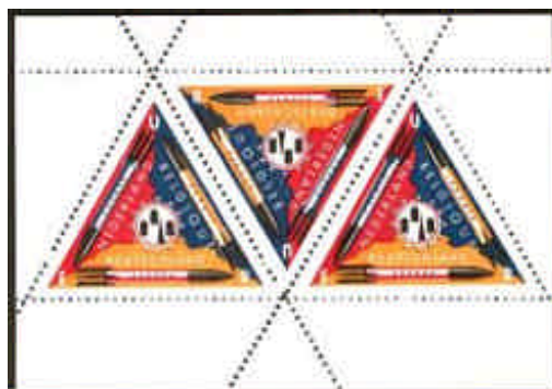
Existe sin dentar