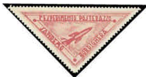
Imagen del valor azul no disponible