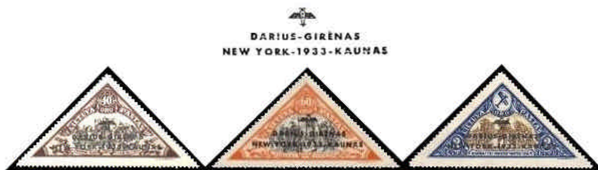
Imagen de los valores 20 centu y 1 lita no disponibles

En homenaje a su hazaña y como recuerdo de su trágica muerte, el Consulado General de Lituania en Nueva York sobrecargó cinco valores de una serie emitida por ese estado báltico en 1932 (Yvert A63-67, Michel 343-47, Scott C58-62). Existen valores tanto dentados como sin dentar.