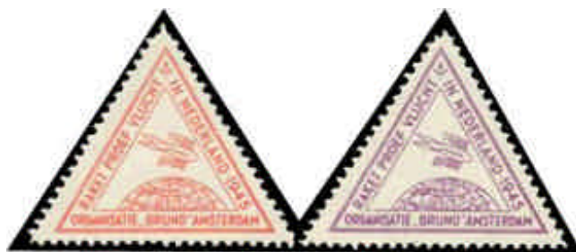
La viñeta de color rojo existe sin dentar