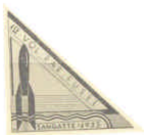
Dentada y sin dentar