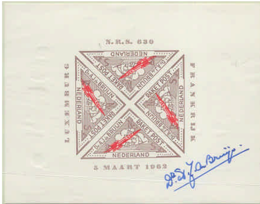
Imagen de la viñeta dentada no disponible